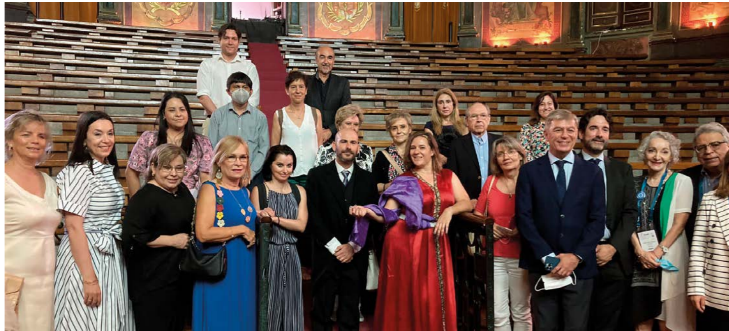
Foto de grupo tras la visita guiada por el Colegio de Médicos de Madrid.